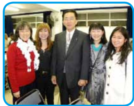
歓迎会で知事と懇談する留研生たち