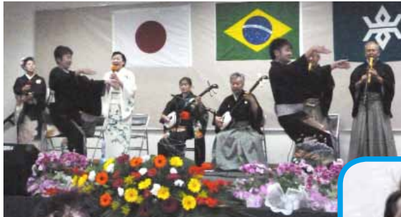
郷土芸能使節の公演