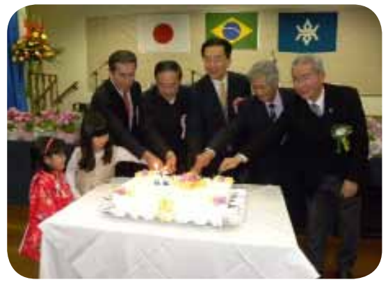
55周年記念のケーキ