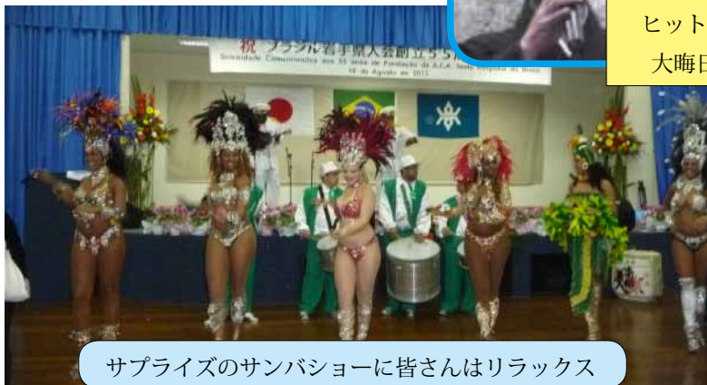
サプライズのサンバショーに皆さんはリラックス