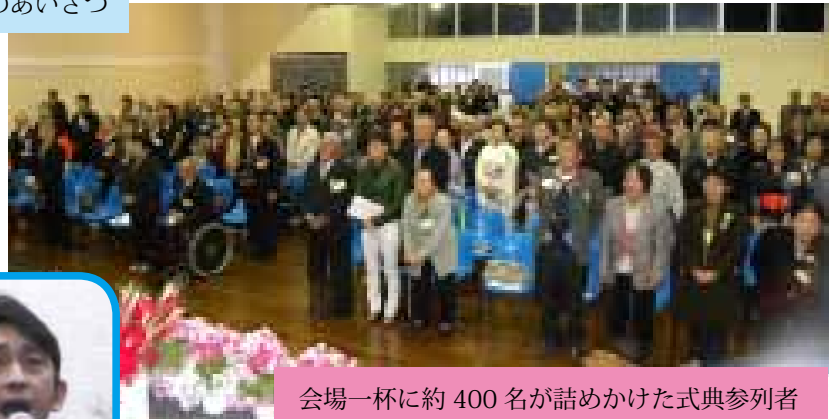
会場一杯に約400名が詰めかけた式典参加者