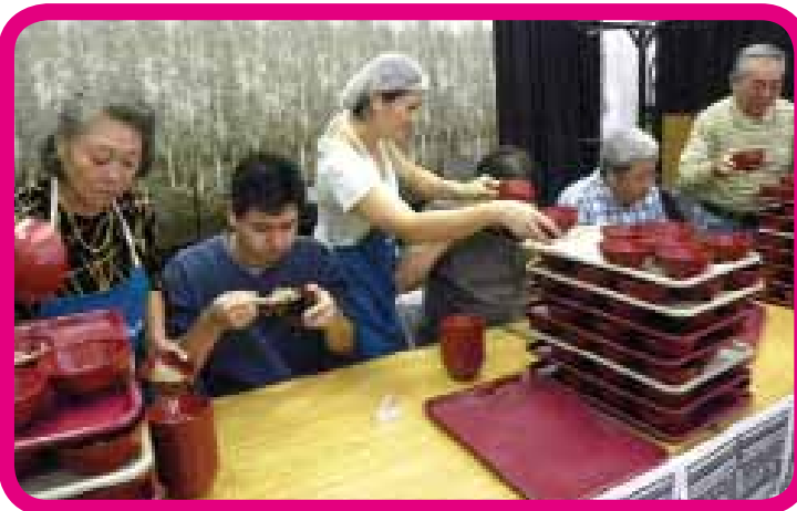
郷土食「わんこそば大会」で、3分間で105杯の新記録も

3日間で18万人の人出があった日系最大のまつり 16° Festival do Japão この祭りで若い人たちの出会いや交流、ボランティアが生まれる